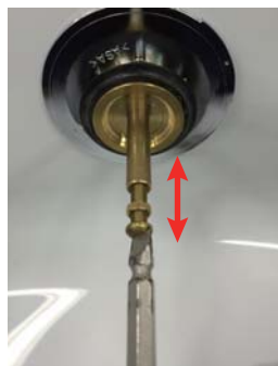
②ポップアップ調整ビスの長さを調整する。