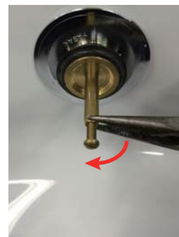
③調整後、ビスが緩まないようにロックナットを締めて固定する。

※調整ビスは20ミリ以内で設定し、排水栓が適切に開閉する設定してください。20ミリ以上ビスを出すと、排水金具が破損する場合がありますのでご注意ください。