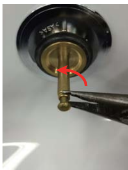
①ロックナットを緩めます。