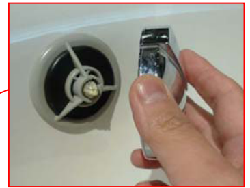
ハンドルの軸が折れた状態