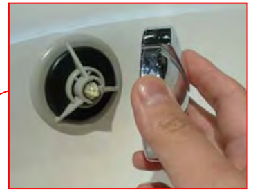
ハンドルの軸が折れた状態